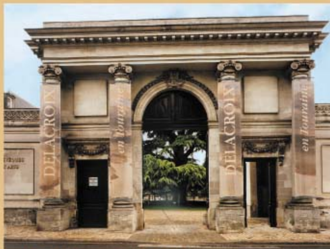
MUSÉE DES BEAUX ARTS DE TOURS