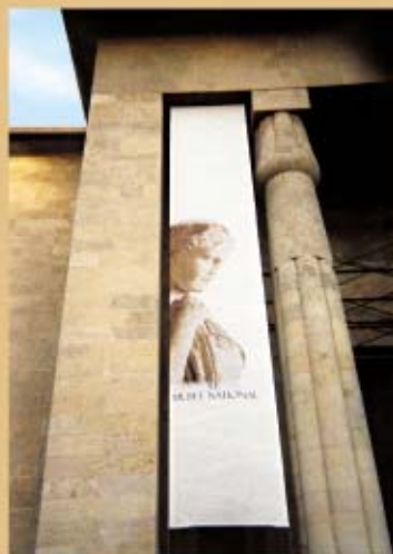
MUSÉE NATIONAL DE BEYROUTH

Confectionner des ourlets sur la périphérie pour poser les œillets. Make hems all around the screen to put eyelets.